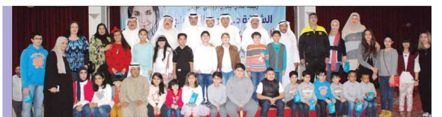
الفهد والفودري والفاسي وابو القاسم مع عدد من المتفوقين وأولياء أمورهم